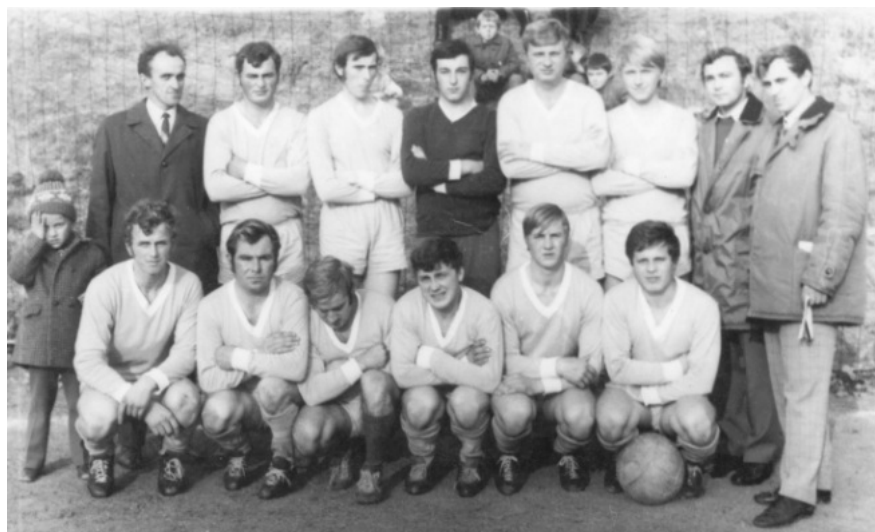
Pušovce 70 roky