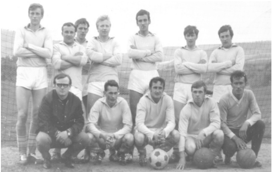
Lipovce - 60 roky