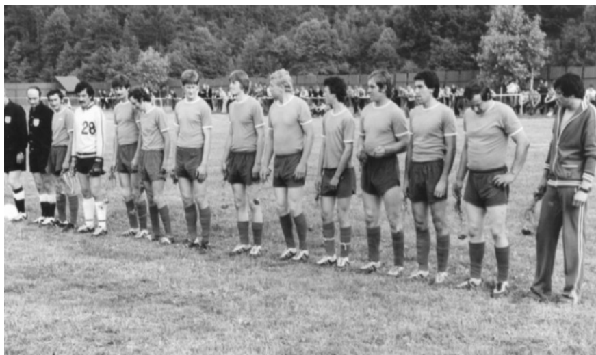
Chminianská Nová Ves 1979