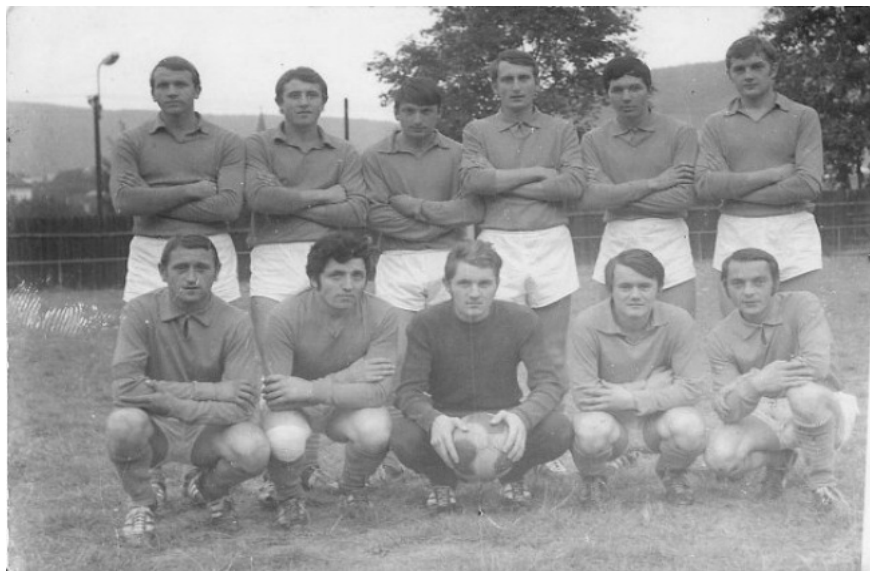
Demjata - 70 roky