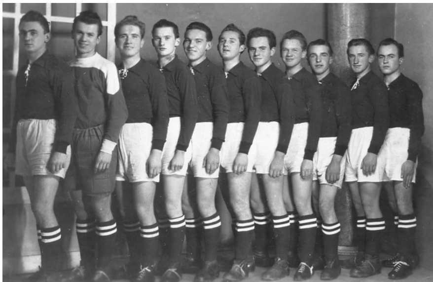
Pečovská Nová Ves 1954