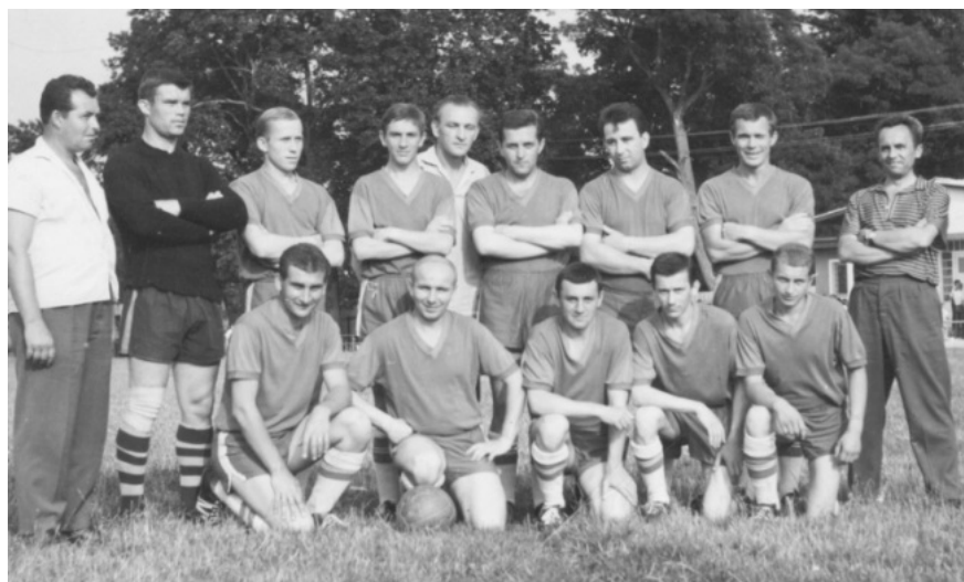
Lemešany - 60 roky