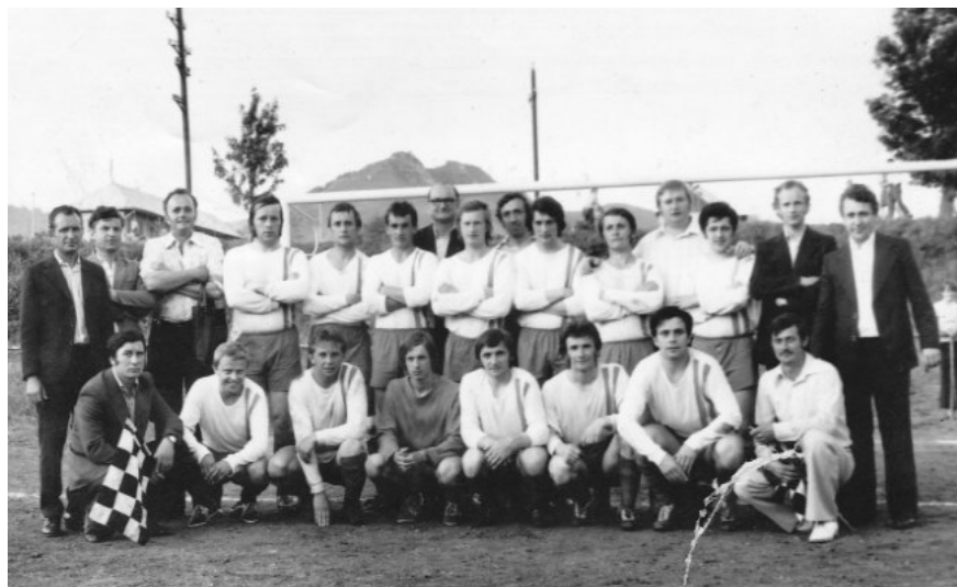
Kamenica - 70 roky