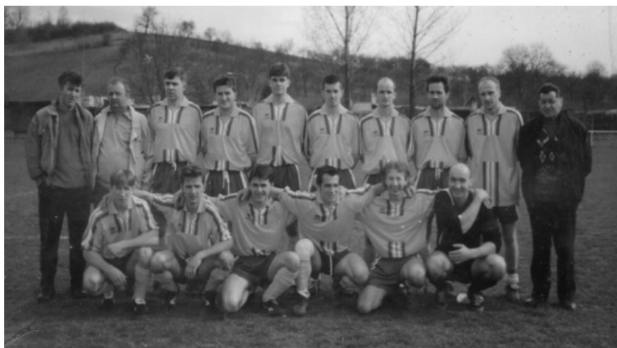
Malý Šariš - 90 roky