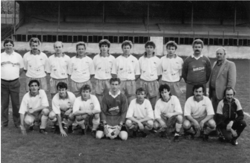
Široké - 80 roky