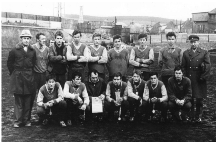
Dukla Prešov - 1977, II. ročník Zimného turnaja OFZ