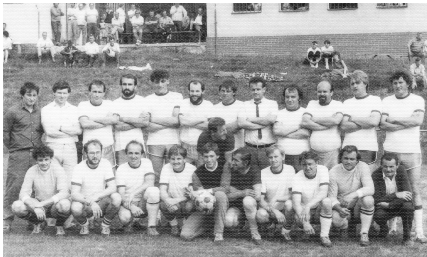
Ruská Nová Ves 1987