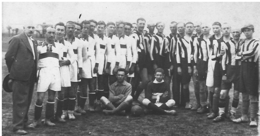
Lipany 1932 Spoločná snímka mužstva z Lipian a ŠK Prešov