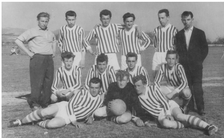
Rožkovany - 60 roky