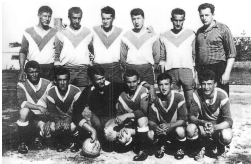
Jarovnice - 60 roky