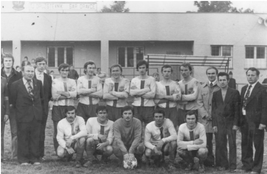
Šarišské Dravce 70 roky