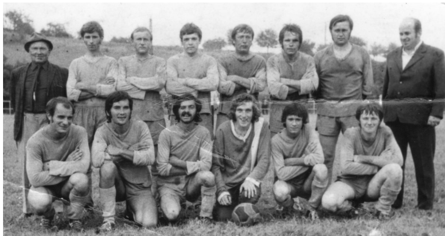
Chmiňany - 60 roky