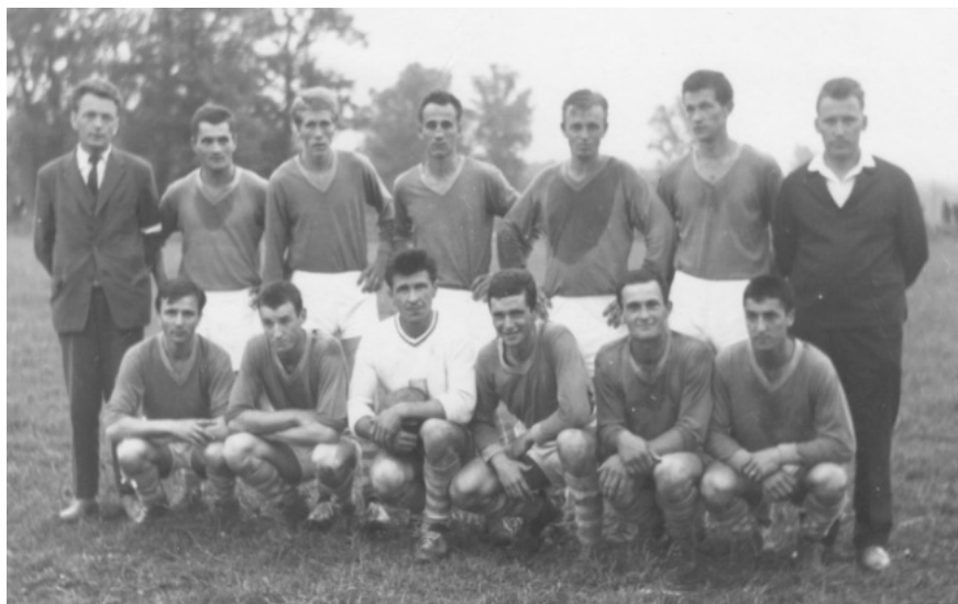
Šarišské Michaľany 1964 - postup do krajskej súťaže