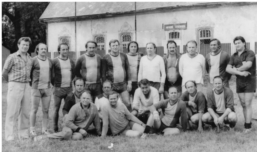
Pečovská Nová Ves - 80 roky