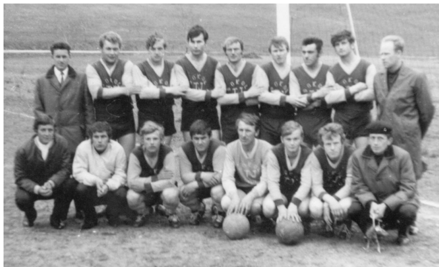
Dubovica - 70 roky