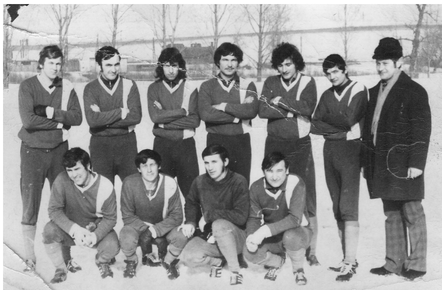
Dulova Ves - 70 roky